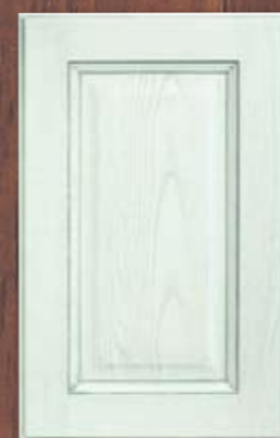
ANTE LEGNO FINITURA MENTA 67 MINT FINISH WOODEN DOORS 67 PORTES EN BOIS FINITION MENTHE 67 PUERTAS DE MADERA CON ACABADO EN MENTA 67 ДЕРЕВЯННЫЕ СТВОРКИ С ОТДЕЛКОЙ ЦВЕТА МЯТЫ 67