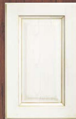
ANTE LEGNO FINITURA ORO 69 GOLD FINISH WOODEN DOORS 69 PORTES EN BOIS FINITION OR 69 PUERTAS DE MADERA CON ACABADO EN ORO 69 ДЕРЕВЯННЫЕ СТВОРКИ С ОТДЕЛКОЙ ЗОЛОТОГО ЦВЕТА 69