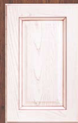
ANTE LEGNO FINITURA LAMPONE 65 RASPBERRY FINISH WOODEN DOORS 65 PORTES EN BOIS FINITION FRAMBOISE 65 PUERTAS DE MADERA CON ACABADO EN FRAMBUESA 65 ДЕРЕВЯННЫЕ СТВОРКИ С ОТДЕЛКОЙ МАЛИНОВОГО ЦВЕТА 65