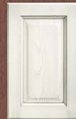
ANTE LEGNO FINITURA ARGENTO 70 SILVER FINISH WOODEN DOORS 70 PORTES EN BOIS FINITION ARGENT 70 PUERTAS DE MADERA CON ACABADO EN PLATA 70 ДЕРЕВЯННЫЕ СТВОРКИ С ОТДЕЛКОЙ СЕРЕБРЯНОГО ЦВЕТА 70