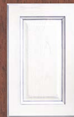
ANTE LEGNO FINITURA LILLA 66 LILAC FINISH WOODEN DOORS 66 PORTES EN BOIS FINITION LILAS 66 PUERTAS DE MADERA CON ACABADO EN LILA 66 ДЕРЕВЯННЫЕ СТВОРКИ С ОТДЕЛКОЙ СИРЕНЕВОГО ЦВЕТА 66