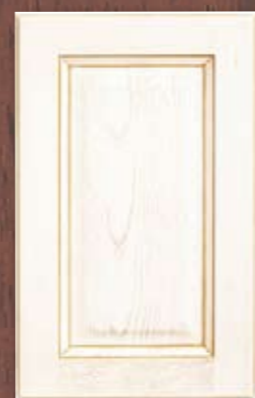
ANTE LEGNO FINITURA CEDRO 62 CEDAR FINISH WOODEN DOORS 62 PORTES EN BOIS FINITION CEDRAT 62 PUERTAS DE MADERA CON ACABADO EN CEDRO 62 ДЕРЕВЯННЫЕ СТВОРКИ С ОТДЕЛКОЙ ЦВЕТА ЦИТРОНА 62