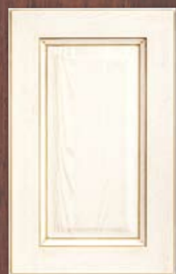
ANTE LEGNO FINITURA NOCCIOLA 61 HAZELNUT FINISH WOODEN DOORS 61 PORTES EN BOIS FINITION NOISETTE 61 PUERTAS DE MADERA CON ACABADO EN HABANA 61 ДЕРЕВЯННЫЕ СТВОРКИ С ОТДЕЛКОЙ ЦВЕТА ЛЕСНОГО ОРЕХА 61