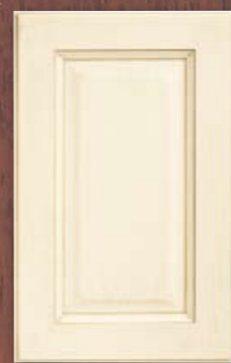
ANTE LEGNO FINITURA CREMA 60 CREAM 60 FINISH WOODEN DOORS PORTES EN BOIS FINITION CREME 60 PUERTAS DE MADERA CON ACABADO EN CREMA 60 ДЕРЕВЯННЫЕ СТВОРКИ С ОТДЕЛКОЙ КРЕМОВОГО ЦВЕТА 60