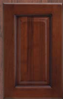
ANTE LEGNO FINITURA NOCE WALNUT FINISH WOODEN DOORS PORTES EN BOIS FINITION NOYER PUERTAS DE MADERA CON ACABADO EN NOGAL ДЕРЕВЯННЫЕ СТВОРКИ ИЗ ДЕРЕВА

Laguna finishes. Les finitions de Laguna. Los acabados de Laguna. Отделки Laguna.