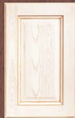
ANTE LEGNO FINITURA SALMONE 64 SALMON FINISH WOODEN DOORS 64 PORTES EN BOIS FINITION SAUMON 64 PUERTAS DE MADERA CON ACABADO EN SALMÓN 64 ДЕРЕВЯННЫЕ СТВОРКИ С ОТДЕЛКОЙ РОЗОВО-ОРАНЖЕВОГО ЦВЕТА 64