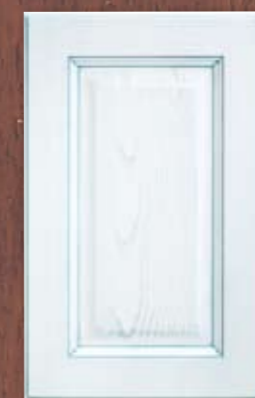
ANTE LEGNO FINITURA AZZURRO 68 SKY BLUE FINISH WOODEN DOORS 68 PORTES EN BOIS FINITION BLEU CIEL 68 PUERTAS DE MADERA CON ACABADO EN CELESTE 68 ДЕРЕВЯННЫЕ СТВОРКИ С ОТДЕЛКОЙ ГОЛУБОГО ЦВЕТА 68