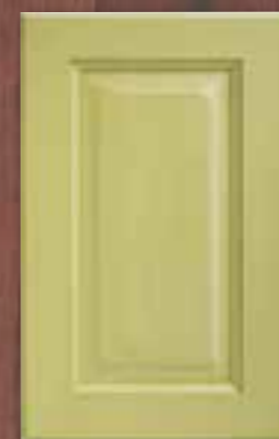
ANTE LEGNO FINITURA MALVA 84 MAUVE 84 FINISH WOODEN DOORS PORTES EN BOIS FINITION MAUVE 84 PUERTAS DE MADERA CON ACABADO EN MALVA 84 ДЕРЕВЯННЫЕ СТВОРКИ С ОТДЕЛКОЙ ЦВЕТА МАЛЬВЫ 84