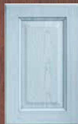
ANTE LEGNO FINITURA RUGIADA 81 DEW 81 FINISH WOODEN DOORS PORTES EN BOIS FINITION ROSEE 81 PUERTAS DE MADERA CON ACABADO EN ROCÍO 81 ДЕРЕВЯННЫЕ СТВОРКИ С ОТДЕЛКОЙ ЦВЕТА РОСЫ 81