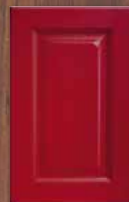
ANTE LEGNO FINITURA ZENZERO 82 GINGER 82 FINISH WOODEN DOORS PORTES EN BOIS FINITION GINGEMBRE 82 PUERTAS DE MADERA CON ACABADO EN JENGIBRE 82 ДЕРЕВЯННЫЕ СТВОРКИ С ОТДЕЛКОЙ ЦВЕТА ИМБИРЯ 82