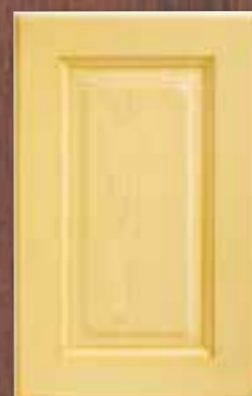
ANTE LEGNO FINITURA SENAPE 83 MUSTARD 83 FINISH WOODEN DOORS PORTES EN BOIS FINITION MOUTARDE 83 PUERTAS DE MADERA CON ACABADO EN MOSTAZA 83 ДЕРЕВЯННЫЕ СТВОРКИ С ОТДЕЛКОЙ ГОРЧИЧНОГО ЦВЕТА 83