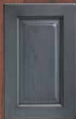
ANTE LEGNO FINITURA ANTRACITE 80 ANTHRACITE 80 FINISH WOODEN DOORS PORTES EN BOIS FINITION ANTHRACITE 80 PUERTAS DE MADERA CON ACABADO EN ANTRACITA 80 ДЕРЕВЯННЫЕ СТВОРКИ С ОТДЕЛКОЙ АНТРАЦИТОВОГО ЦВЕТА 80