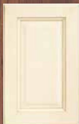
ANTE LEGNO FINITURA CREMA 60 CREAM 60 FINISH WOODEN DOORS PORTES EN BOIS FINITION CREME 60 PUERTAS DE MADERA CON ACABADO EN CREMA 60 ДЕРЕВЯННЫЕ СТВОРКИ С ОТДЕЛКОЙ КРЕМОВОГО ЦВЕТА 60

Canova finishes. Les finitions de Canova. Los acabados de Canova. Отделки Canova.