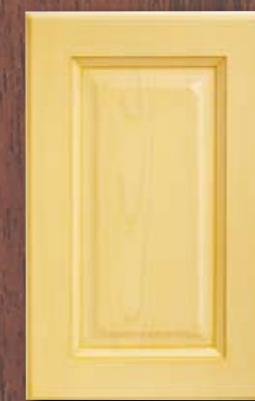
ANTE LEGNO FINITURA SENAPE 83 MUSTARD 83 FINISH WOODEN DOORS PORTES EN BOIS FINITION MOUTARDE 83 PUERTAS DE MADERA CON ACABADO EN MOSTAZA 83 ДЕРЕВЯННЫЕ СТВОРКИ С ОТДЕЛКОЙ ГОРЧИЧНОГО ЦВЕТА 83