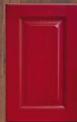
ANTE LEGNO FINITURA ZENZERO 82 GINGER 82 FINISH WOODEN DOORS PORTES EN BOIS FINITION GINGEMBRE 82 PUERTAS DE MADERA CON ACABADO EN JENGIBRE 82 ДЕРЕВЯННЫЕ СТВОРКИ С ОТДЕЛКОЙ ЦВЕТА ИМБИРЯ 82