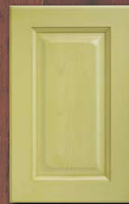
ANTE LEGNO FINITURA MALVA 84 MAUVE 84 FINISH WOODEN DOORS PORTES EN BOIS FINITION MAUVE 84 PUERTAS DE MADERA CON ACABADO EN MALVA 84 ДЕРЕВЯННЫЕ СТВОРКИ С ОТДЕЛКОЙ ЦВЕТА МАЛЬВЫ 84