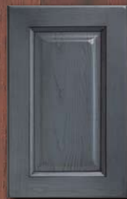
ANTE LEGNO FINITURA ANTRACITE 80 ANTHRACITE 80 FINISH WOODEN DOORS PORTES EN BOIS FINITION ANTHRACITE 80 PUERTAS DE MADERA CON ACABADO EN ANTRACITA 80 ДЕРЕВЯННЫЕ СТВОРКИ С ОТДЕЛКОЙ АНТРАЦИТОВОГО ЦВЕТА 80