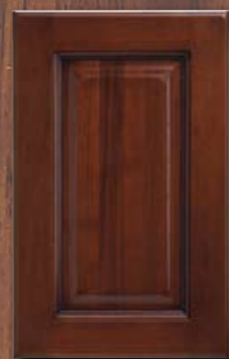
ANTE LEGNO FINITURA NOCE WALNUT FINISH WOODEN DOORS PORTES EN BOIS FINITION NOYER PUERTAS DE MADERA CON ACABADO EN NOGAL ДЕРЕВЯННЫЕ СТВОРКИ ИЗ ДЕРЕВА

Canova finishes. Les finitions de Canova. Los acabados de Canova. Отделки Canova.