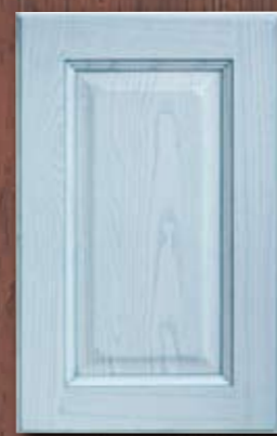
ANTE LEGNO FINITURA RUGIADA 81 DEW 81 FINISH WOODEN DOORS PORTES EN BOIS FINITION ROSEE 81 PUERTAS DE MADERA CON ACABADO EN ROCÍO 81 ДЕРЕВЯННЫЕ СТВОРКИ С ОТДЕЛКОЙ ЦВЕТА РОСЫ 81